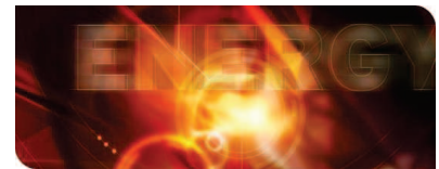
KIT-Zentrum Energie: Zukunft im Blick